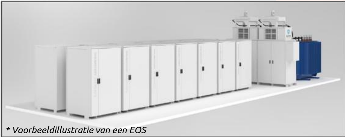
* Voorbeeldillustratie van een EOS